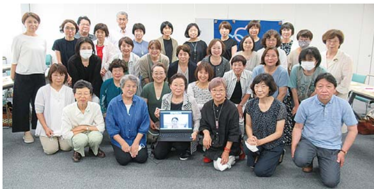
令和4年度 役員、支部長、幹事長 (7月21日(木) 合同会議会場にて)