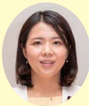
参議院議員 友納 理緒

この度は、第26回参議院議員通常選挙にあたり、多大なるご支援を賜り、心よりお礼申し上げます。いただきました「17万4335票」という大切な票の1票1票の重みを日々実感しております。