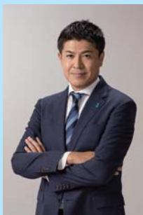
参議院議員 小林 一大

平素より新潟県看護連盟の皆さまには、私の政治活動に格別のご理解ご協力を賜り厚く御礼申し上げます。