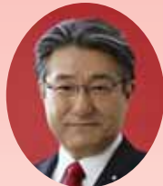
参議院厚生労働委員長 参議院議員 石田 まさひろ

新潟県看護連盟の皆様、日頃より温かいご支援を賜りありがとうございます。こちらでは気温はまだ低いとはいえ窓から春めいた日差しが降り注ぐようになってまいりました。 今年は夏のオリンピックが56年ぶりに日本にやってくる大きな年。2020年がすばらしき一年となりますよう心からお祈り申し上げます。 昨年は皆様のお力を頂き、二期目の当選を果たすことができました。一票一票の重みをしっかり感じながら、自らの行動で皆様の期待に応えていく所存です。 そして当選直後から再び全国を飛び回っております。皆様からの温かいお言葉、そして「現場の声」は私の活動の原点です。その声を国政に届け、看護職が「今日も良い看護ができた！」と実感できる環境づくりのために、この六年間、再び尽力してまいります。今年もどうぞよろしくお願い申し上げます。