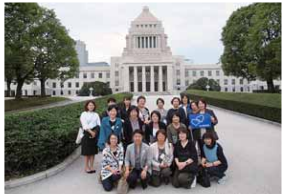
皆様のご参加お待ちしております