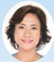
自民党文部科学部会長 参議院議員 たかがい 恵美子

向春の候、新潟県看護連盟の皆様におかれましては、ますますご清祥のことと存じます。平成から令和への御代がわりを経て今夏には東京オリンピック・パラリンピックが開催されるとあって、日本はいま世界で最も注目される国となっています。国政においては、国民に寄り添う豊かな成熟社会を実現するための2040年に向けた新たな社会保障制度設計の議論が進められています。これからの看護職が地域の様々な場所で個性と専門性を活かして活躍できるよう制度整備することや、貴重な看護人材を育てる基礎教育の充実と一人ひとりの生涯を通じたキャリア形成支援の仕組みを整えていくことなど、取り組むべき政策課題は無限にあります。笑顔が輝く未来に向けて、お互い支え合い力を合わせてがんばりましょう。