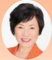
衆議院国会対策副委員長 衆議院議員 あべ 俊子