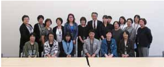
参議院議員会館にて両議員の活動を聞く

と、看護職の働く環境を守るための活動はもちろんのこと、多くの役職を担われていることにあらためて敬服します。国民の命や暮らしを守るという言葉の端々に、看護職としてのシンパシーを頼もしく、とても嬉しく感じた日となりました。