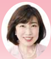
総務大臣政務官 衆議院議員 木村 やよい

新潟県看護連盟の皆様、日頃より温かいご支援を賜りありがとうございます。こちらでは気温はまだ低いとはいえ窓から春めいた日差しが降り注ぐようになってまいりました。 今年は夏のオリンピックが56年ぶりに日本にやってくる大きな年。2020年がすばらしき一年となりますよう心からお祈り申し上げます。 昨年は皆様のお力を頂き、二期目の当選を果たすことができました。一票一票の重みをしっかり感じながら、自らの行動で皆様の期待に応えていく所存です。 そして当選直後から再び全国を飛び回っております。皆様からの温かいお言葉、そして「現場の声」は私の活動の原点です。その声を国政に届け、看護職が「今日も良い看護ができた！」と実感できる環境づくりのために、この六年間、再び尽力してまいります。今年もどうぞよろしくお願い申し上げます。