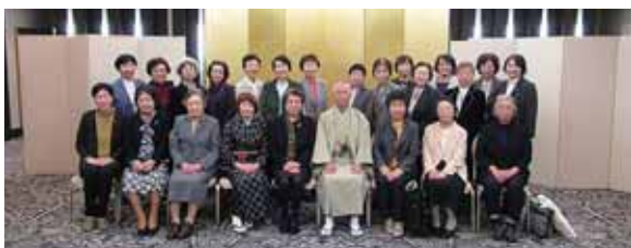
兩名誉会員も参加してなごやかに