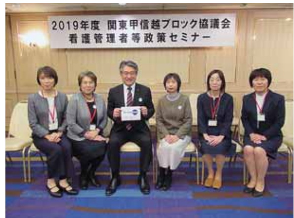
看護政策の実現は連盟の充実から!!

看護連盟に入会した若い頃、セミナーに参加した事があります。その時に、セミナー運営に尽力されていた方々の殆どが第一線を退かれた方であり、現在の看護師は先輩の方々の大きな努力の上に形成されたものであると実感したことを思い出します。看護職の地位の確立と向上が大きなテーマであったが、現在は超高齢化と地域格差が複雑に絡んだ世の中での職業の在り方も課題でもあります。さらに、静脈注射を看護業務とするのに20年掛かる一方、その2年後には特定行為研修終了看護師の育成が始まり、現在ではさらに役割の拡大が検討されています。その激流の中で俯瞰的な視野で次の世代のため今やるべきことを先人を見習い行動することが必要だと感じました。