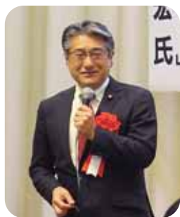
講演 参議院議員 石田まさひろ氏