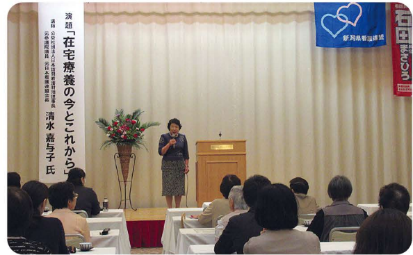
先生の熱を伝え続けよう

考えます。そのためには、高齢化社会に貢献する役割をもつ看護師の存在が認められ、地位向上・環境改善のために政治の力が必要なのであるということを実感しました。年齢を感じさせない先生のパワーには終始圧倒されっぱなしでした。貴重な講演会をありがとうございました。