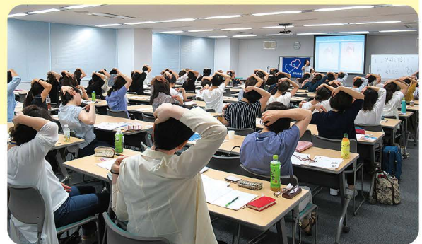
美しい笑顔の看護職になろう