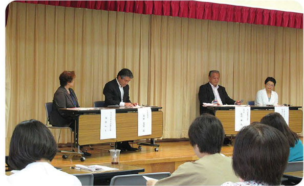
話がはずみフロアの参加者は大満足