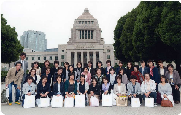
政治が身近になりました