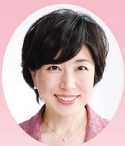
衆議院議員 木村 やよい

新潟県看護連盟の皆様、平素よりの温かいご支援に感謝申し上げます。雪椿の開花が待ち遠しいこの頃です。御代替わりも間近に迫り、2月の陽射しに新しい時代を予感しています。先の国会より参議院厚生労働委員長を拝命いたしました。保助看法を含む厚生労働法制の真ん中で仕事をしています。 特に今は書類、記録の削減に取り組んでいます。これも現場の声を国政に届ける仕事です。 今年も、皆様と力を合わせ、日本を元気にしていきます。