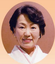
外務副大臣 衆議院議員 あべ 俊子