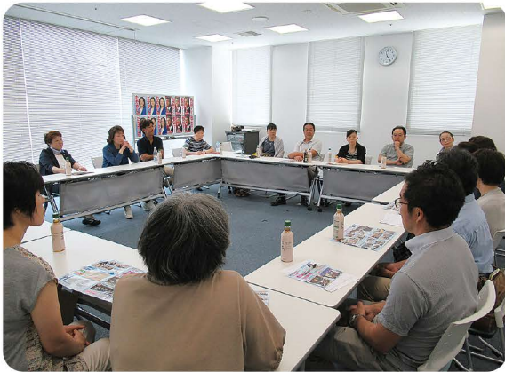
たくさん声を届けました

■日時：平成30年7月28日(土) ■会場：まちなかキャンパス長岡 ■参加者：24名