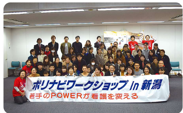
仲間をふやしていくぞ!!

が何よりも大切になってくると感じた。研修を通して看護師である自分に対する見方が変わった。これからも何ができるかを追求し行動に移していきたい。