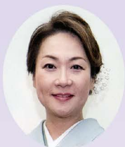
厚生労働副大臣 参議院議員 たかがい 恵美子

皆様お健やかに新春をお迎えのことと存じます。 新潟県看護連盟の皆様には日頃より温かいご支援を賜り、心より感謝申し上げます。昨年は、災害をはじめ、日本が大きく揺れた一年でございました。社会の変化により看護の対象はさらに拡大し、求められるケアも多様化しております。社会の大きな変化から国民の健康を守るためには、看護師皆様のお力が本当に必要です。やりがいのある看護を続けられる制度づくりに全力で取り組みますので、引き続き忌憚ないご指導を賜りますようお願い申し上げます。