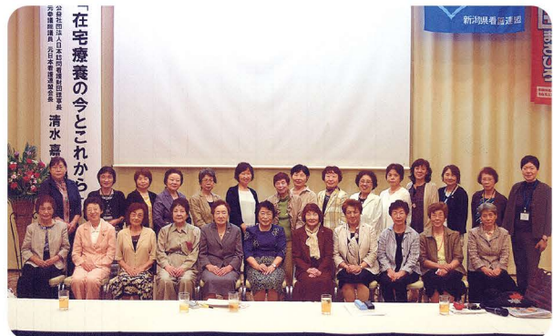
OB会員のパワーを結集しよう