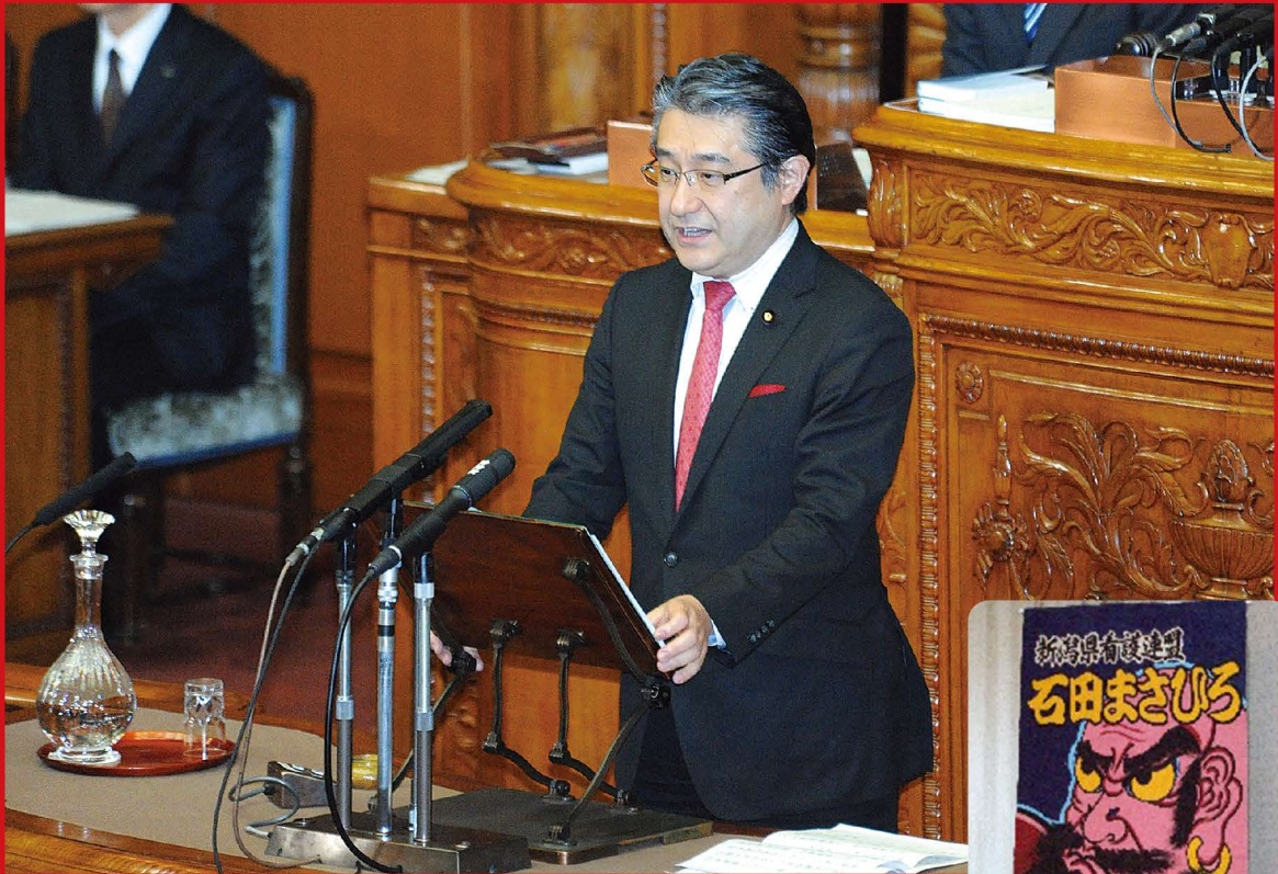
2018.12.8 本会議 厚生労働委員長趣旨説明